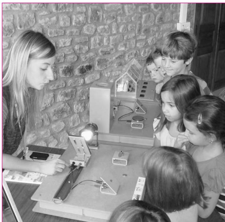
Atelier archéologie et énergie : La palette est large pour intéresser les jeunes publics

Retrouvez tout le programme des manifestations réparties sur toute la Corse sur le www.cpie-centrecorse.fr