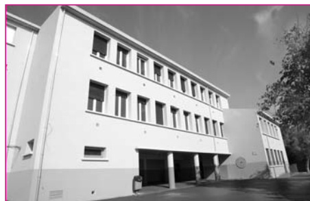
Le groupe scolaire du Petricciu , dit « école Ange Lovisi », a fait peau neuve

L'équipe municipale de Cervioni a fait part de son entière satisfaction à l'occasion de la récente rentrée scolaire au primaire du Petricciu , baptisé « Ecole Ange Lovisi » et l'on peut dire que cette satisfaction était légitime, compte tenu de l'ampleur des travaux de rénovation de l'établissement réalisés durant la période estivale. Une période toute désignée pour entreprendre les travaux de ravalement de la façade, de la réfection totale du revêtement de la cour, et l'installation de stores aux fenêtres. Les petits écoliers du Petricciu ont eu la surprise le jour de la rentrée de découvrir une école toute neuve et comme une surprise n'arrive jamais seule, leur établissement a aussi été doté d'une classe supplémentaire allant de paire avec l'effectif croissant et conforme avec les engagements pris par l'inspecteur d'académie.